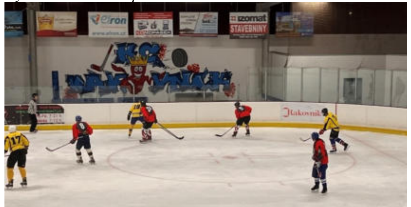
HC Mladotice ve žlutých dresech v akci.