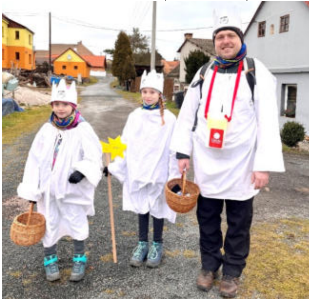
Tříkrálová sbírka (15. 1. 2023).