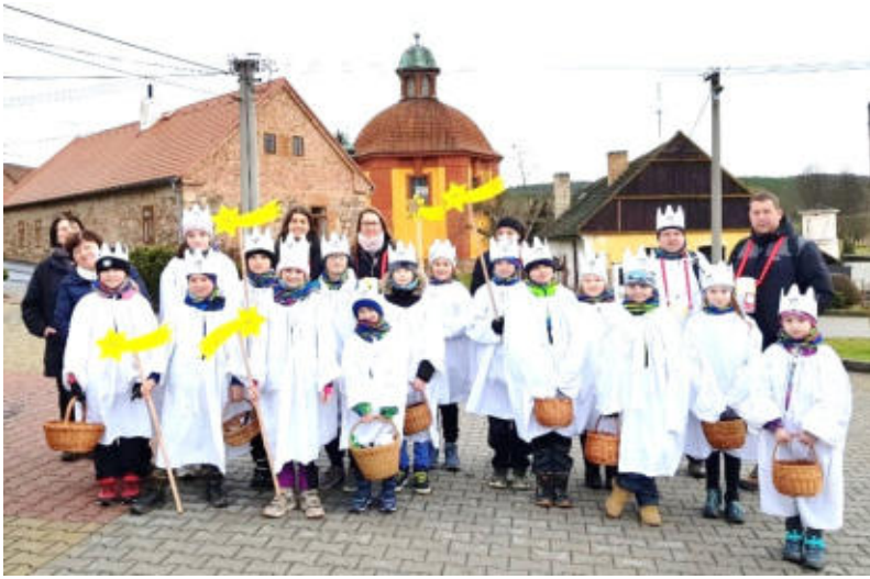
Tříkrálová sbírka (15. 1. 2023).