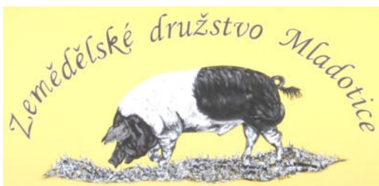
Malba na zdi, autor Martin Havlík

Zemědělské družstvo Mladotice se zabývá konvenčně rostlinnou výrobou a živočišnou výrobou. Z rostlinné výroby obhospodařuje nyní 751 hektarů zemědělské půdy, z toho přibližně 96 hektarů trvalých travních porostů. Osevní postup je složen z těchto hlavních plodin a to ječmen ozimý, pšenice ozimá, řepka ozimá, žito ozimé, kukuřice na siláž, vojtěška, luskoobilné směsky, trávy na orné půdě a oves. Zastoupení hlavních plodin se pohybuje v rozmezí 20 % z celkové zemědělské půdy.