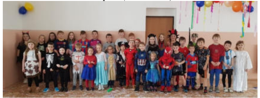
Dětský karneval (21. 1. 2023).