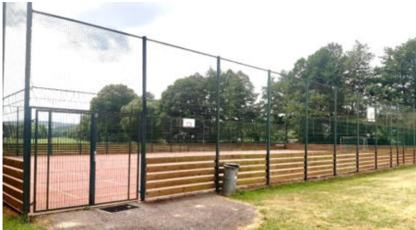
Hřiště s umělým povrchem, Mladotice.