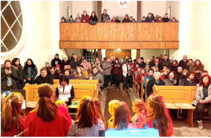
Vánoční koncert (16. 12. 2022).