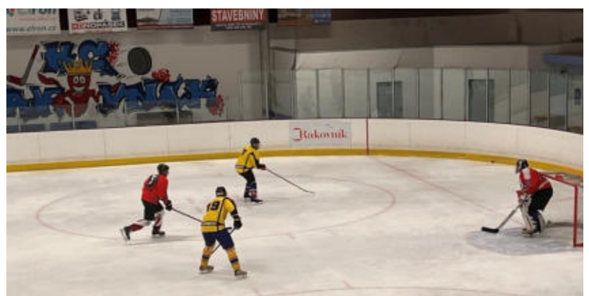
Tým HC Mladotice při útoku na zimním stadionu v Rakovníku.