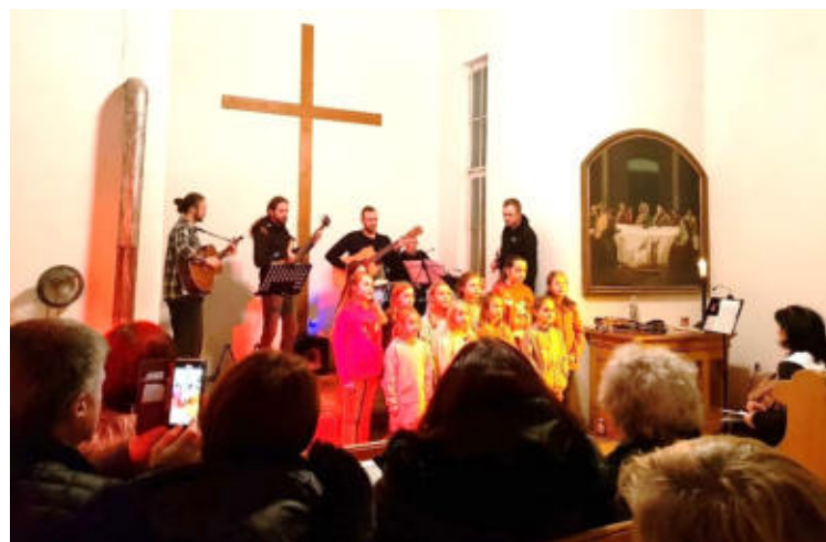
Vánoční koncert kapely Koledníci a dětí ze ZŠ a MŠ Mladotice v Kostece Husova sboru v Mladoticích (16. 12. 2022).