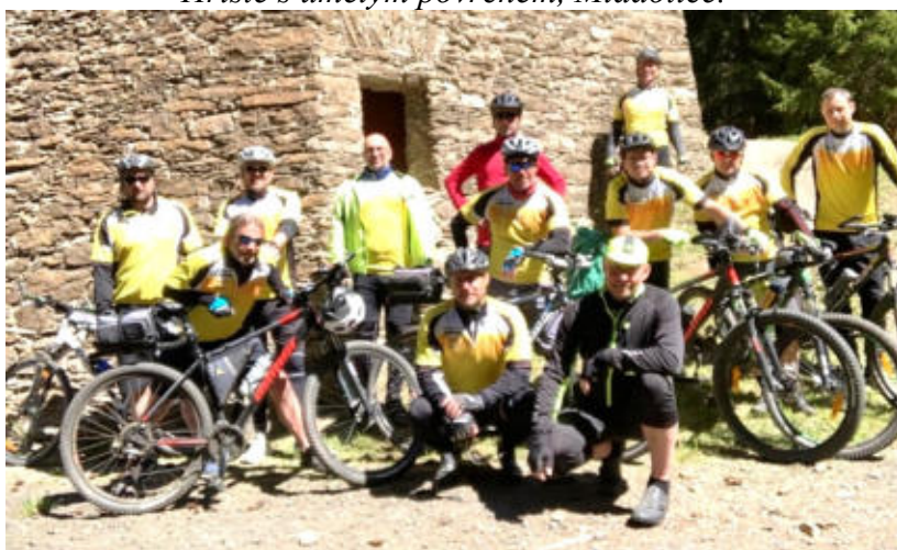
Soustředění mladotického cyklotýmu, Kovářská.