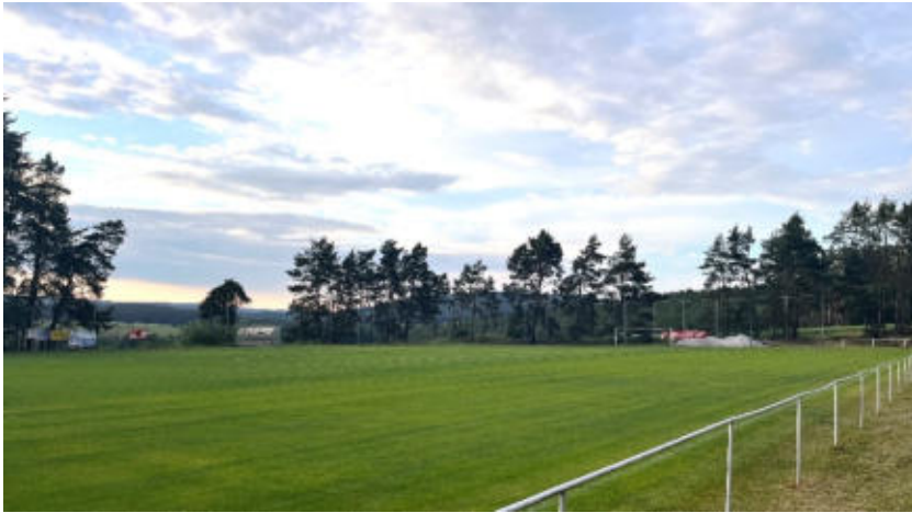
Hřiště TJ Sokol Mladotice.