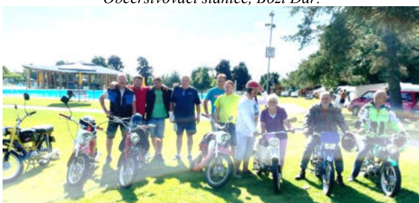
BMC Chrástovice na vyjížďce, Chlumec nad Cidlinou.