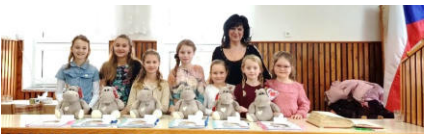
Vítání občánků (4. 2. 2023).