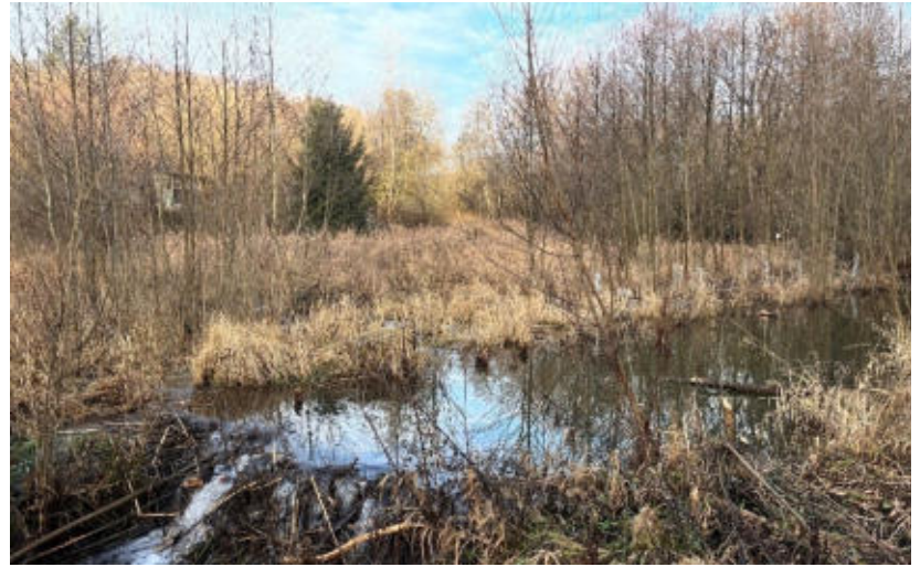
Jedna z bobřích hrází na Mladotickém potoce.