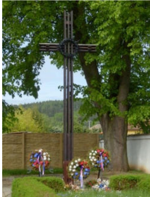
Lidický kříž u památníku a hrobu 273 obětí na žihelském hřbitově

Ještě dnes je na žihelském nádraží při vzpomínce na 22. duben 1945 mrazivo.