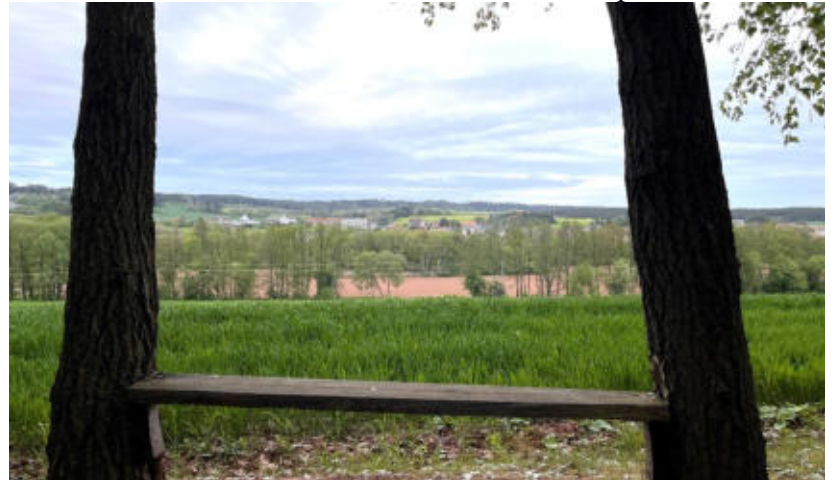
Vyhliídka na Mladotice.