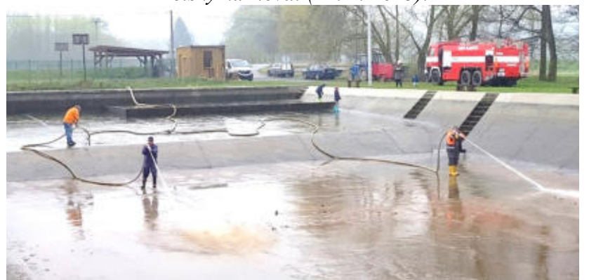
SDH provedl čištění koupaliště (28. 4. 2023).