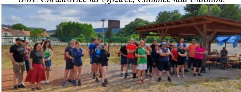
Volejbalový turnaj v Mladoticích (17.6.2023).