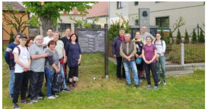
Závěr pochodu u infopanelu se jmény osvobozených vězňů v Mladoticích vedle pomníku mladotickým občanům