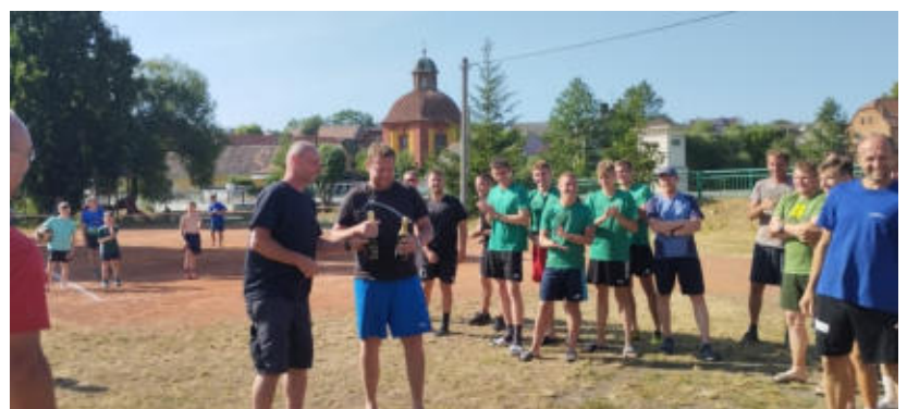
Nohejbalový turnaj v Mladoticích (24.6.2023).