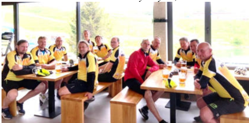
Občerstvovací stanice, Boží Dar.