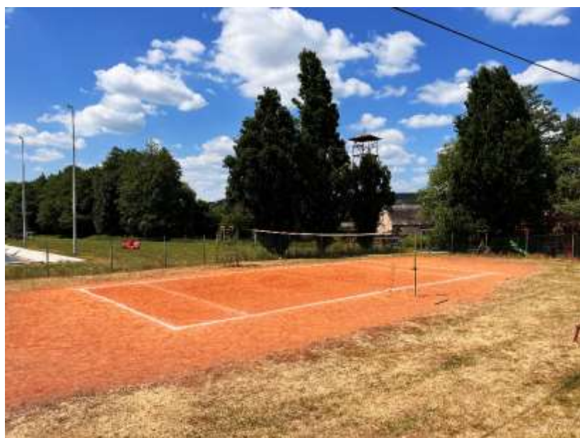
Antukové hřiště u koupaliště