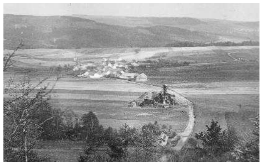
Pohled na důl Josef a blíže k vesnici důl Karel 1940-45

Hloubení nové těžební jámy nového dolu s názvem Kamenouhelný důl Karel bylo započato v prvním pololetí roku 1939. Hloubka dolu byla 28 m. Těžba se prováděla dvěma klecemi na vozíky o obsahu 350 kilogramů uhlí. Obytové poměry byly velmi dobré a důl měl pro kralovický okres značný význam. Nevýhodou byla velká křehkost uhlí, které velmi špatně snášelo vagónovou dopravu. Moury a průmyslové uhlí byly odváženy auty přímo do závodů, nebo na vagóny do Mladotic. Uhlí se v malém prodávalo v okolí, dále úřadům, školám a průmyslové druhy uhlí do továren. Zaměstnáno bylo v podniku v průměru kolem čtyřiceti pracovníků. Důl ukončil svoji činnost pro velké množství vody a špatné geologické podmínky v roce 1942.