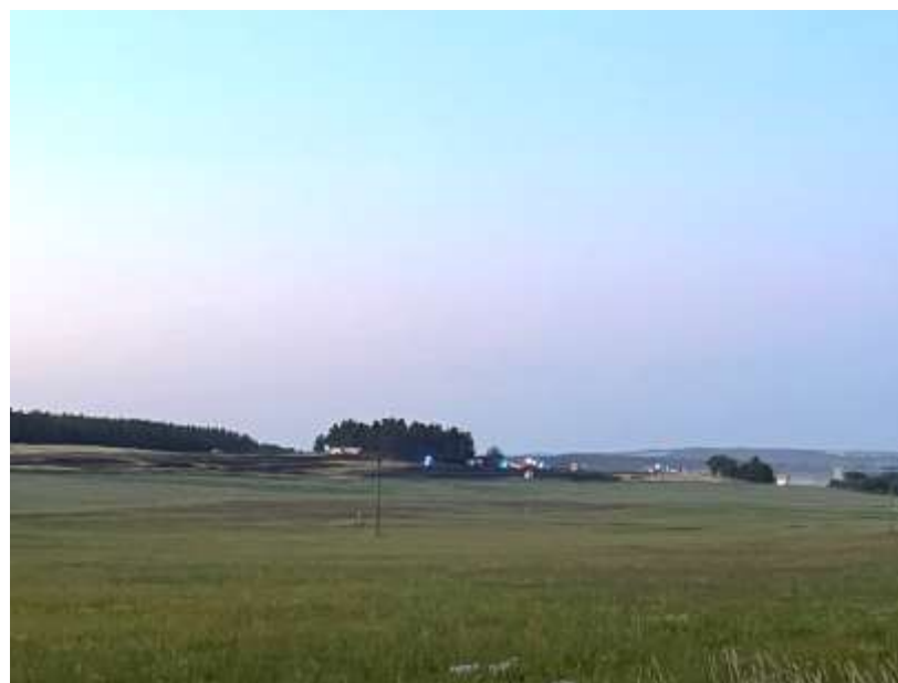
Požár pole u Štichovic, kde zasahovala také jednotka z Mladotic 8.7.2023