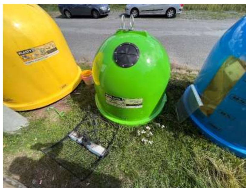
Kontejnery na tříděný odpad, prosíme o udržování pořádku