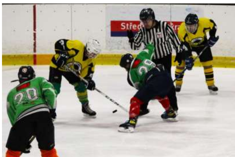
Zápas HC Mladotice vs. BK Kralovicko na ZS v Rakovníku 28.11.2023