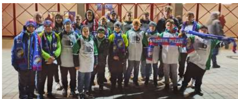
9.11.2023 návštěva dětí TJ Sokol Mladotice na fotbalovém utkání FC Viktoria Plzeň – Dinamo Záhřeb 1:0

STARTOVNÉ 200,- V CENĚ STARTOVNÉHO JE MALÉ OBČERSTVENÍ