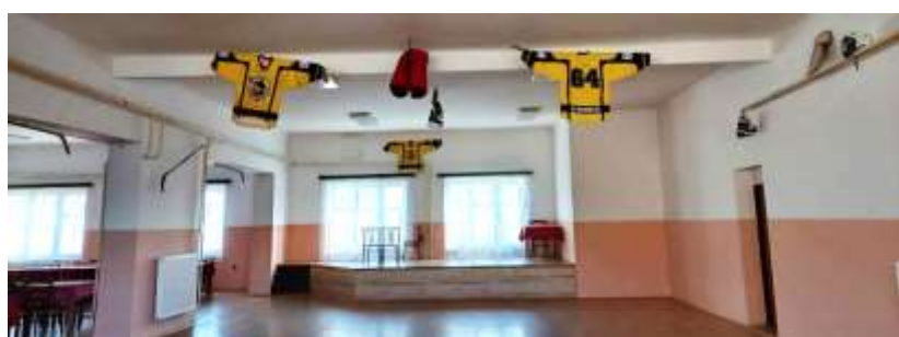
Výzdoba sálu před hokejovou zábavou 25.11.2023 na sále v Mladoticích