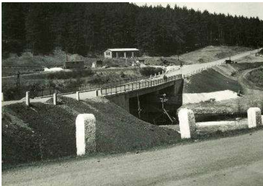
Výstavba nového mostu přes řeku Střelu, asi tak v roce 1964.

Zajímá vás dané místo víc? Možná se vám dostala do rukou kniha „Stále tajné aneb jak jsem sloužil v Mladoticích“.