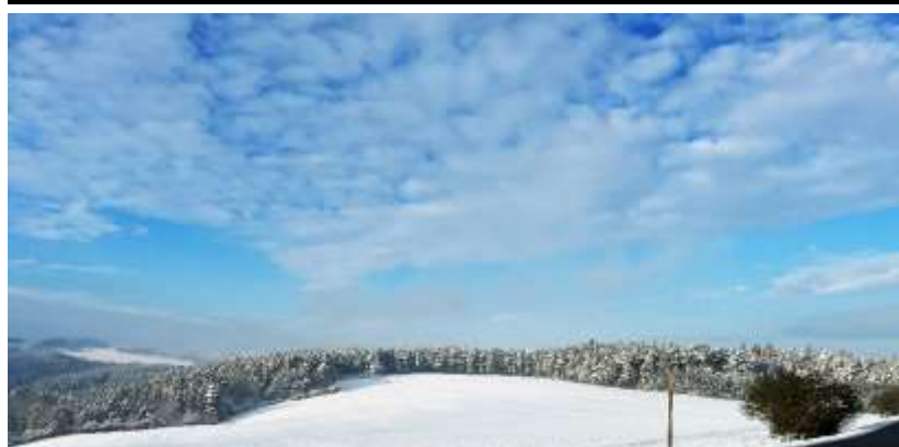
Zasněžený pohled do údolí od Horního Hradiště směrem k Malované skále, 30.11.2023